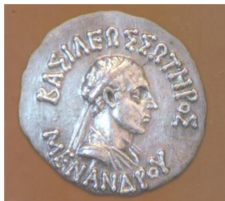
Νόμισμα του Μένανδρου: Πρόσθια όψη: «ΒΑΣΙΛΕΩΣ ΣΩΤΗΡΟΣ ΜΕΝΑΝΔΡΟΥ».

Ο Μένανδρος Α΄, ο οποίος έχει περιγραφεί ως ο μεγαλύτερος και διάσημος των Ελληνοϊνδών βασιλέων, θεωρείται ως μεγάλος προστάτης του Βουδισμού. Ήταν ένας από τους βασιλείς του Ινδοελληνικού βασιλείου από το 163 π.Χ. έως το 145 π.Χ. Γνωστός ως Μένανδρος ο Δίκαιος, είχε την πρωτεύουσά του στην Σάγκαλα ( Sāgala ), τη σημερινή Σιαλκότ στο Παντζάμπ του Πακιστάν.