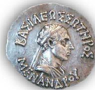
Νόμισμα του Μενάνδρου. Πρόσθια όψη: «ΒΑΣΙΛΕΩΣ ΣΩΤΗΡΟΣ ΜΕΝΑΝΔΡΟΥ»

Ο Μένανδρος Α΄, ο οποίος έχει περιγραφεί ως ο μεγαλύτερος και πιο διάσημος των ελληνοϊνδών βασιλέων, θεωρείται μεγάλος προστάτης του Βουδισμού. Ήταν ένας από τους βασιλείς του ινδοελληνικού βασιλείου από το 165 π.Χ. έως το 145 π.Χ. Γνωστός ως Μένανδρος ο Δίκαιος, είχε την πρωτεύουσά του στη Σάγκαλα ( Sāgala ), στη σημερινή Σιαλκότ στο Παντζάμπ του Πακιστάν. Ασπάστηκε και προώθησε τον Βουδισμό, και στην ινδική παράδοση αποκαλείται Μιλίντα . Οι διάλογοί του με τον βουδιστή μοναχό Νάγκασενα ( Nāgasena ), ο οποίος είναι γνωστός για τη μεταστρο-